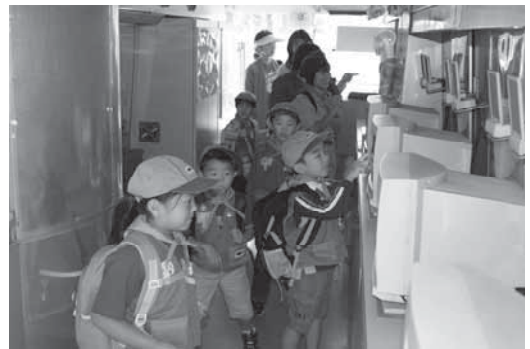
キャラバンカーの中で見学