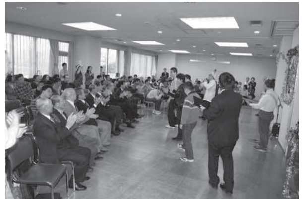
ボランティアの方々と一緒にたくさん歌いました。