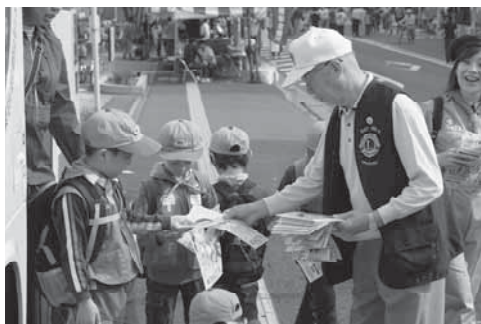
見学した子供達へプレゼント