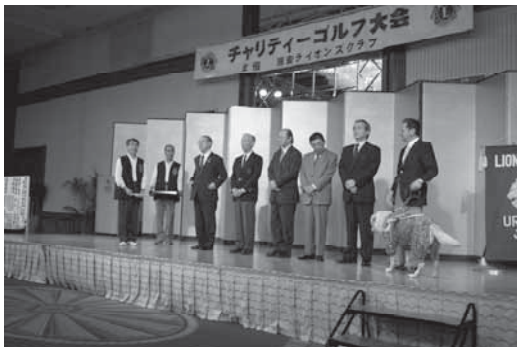
市内各団体に心からのアクティビティを行いました。