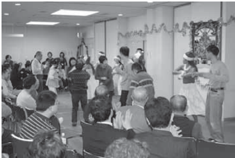
みんなで楽しくフラダンス。