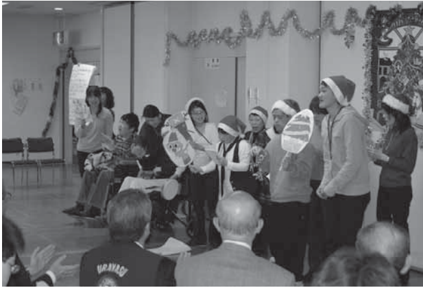
めだか少年学級の皆さんから 元気な歌を披露いただきました。