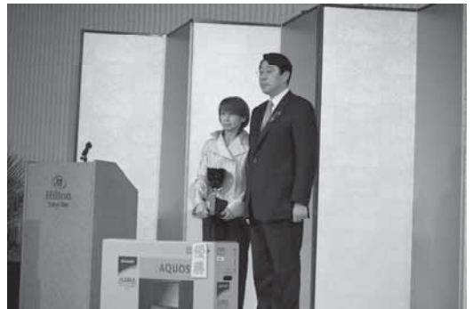
チャリティーゴルフ成績発表及び表彰式