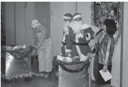
お楽しみのクリスマスプレゼント。名前が呼びあげられサンタさんから皆にプレゼント。