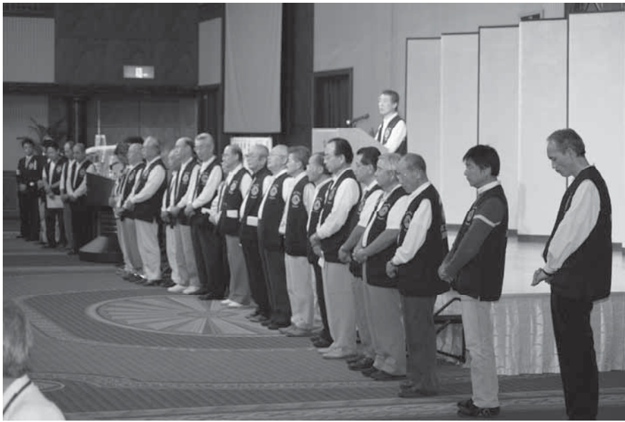
メンバー揃ってお礼の挨拶