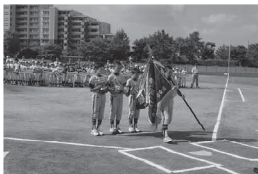
第57回浦安市少年野球大会