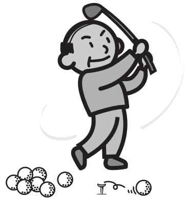
チャリティーゴルフ大会会場 「姉ヶ崎カントリークラブ」