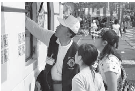
見学記念のプリントシールコーナー